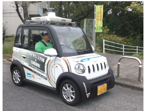
自動運転南区実証実験

泉北の実証実験車両は独立自立走行(GPS仕様)でワイヤレス充電ができる最新の技術が盛り込まれていました。