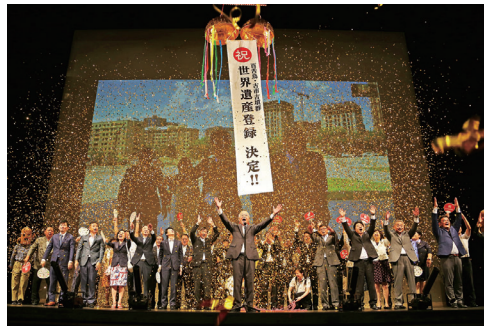
世界遺産登録決定 フェニーチェ堺にて