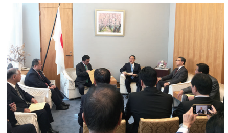
指定都市議長会で菅官房長官に要望活動