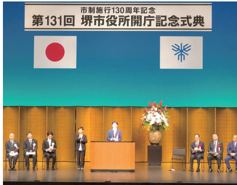
開庁記念式典で挨拶