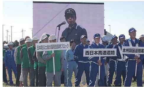
市長と大規模津波防災総合訓練に出席