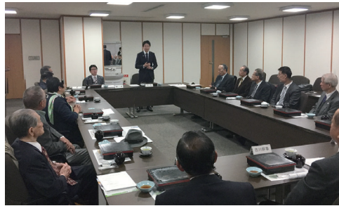
歴代議長会 市長とともに