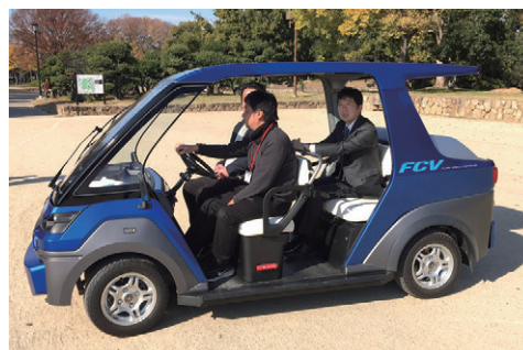
大仙公園モビリティ

大仙公園にて試乗させていただいた車両はヤマハ製で、水素エネルギーにて駆動し、環境にやさしい仕様で地中に電磁誘導線を埋めることで自動運転にも対応することでした。民間の技術を活かした次世代の交通手段として実用が期待されます。