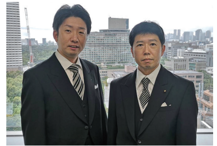
市長とともに即位礼正殿の儀へ参列