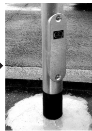
交換された水銀灯