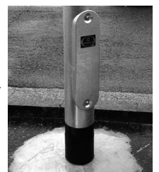
交換された水銀灯